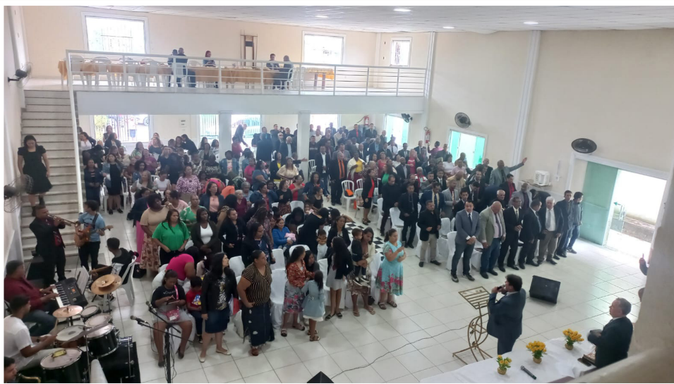
Reunião da Sam da Região Serrana