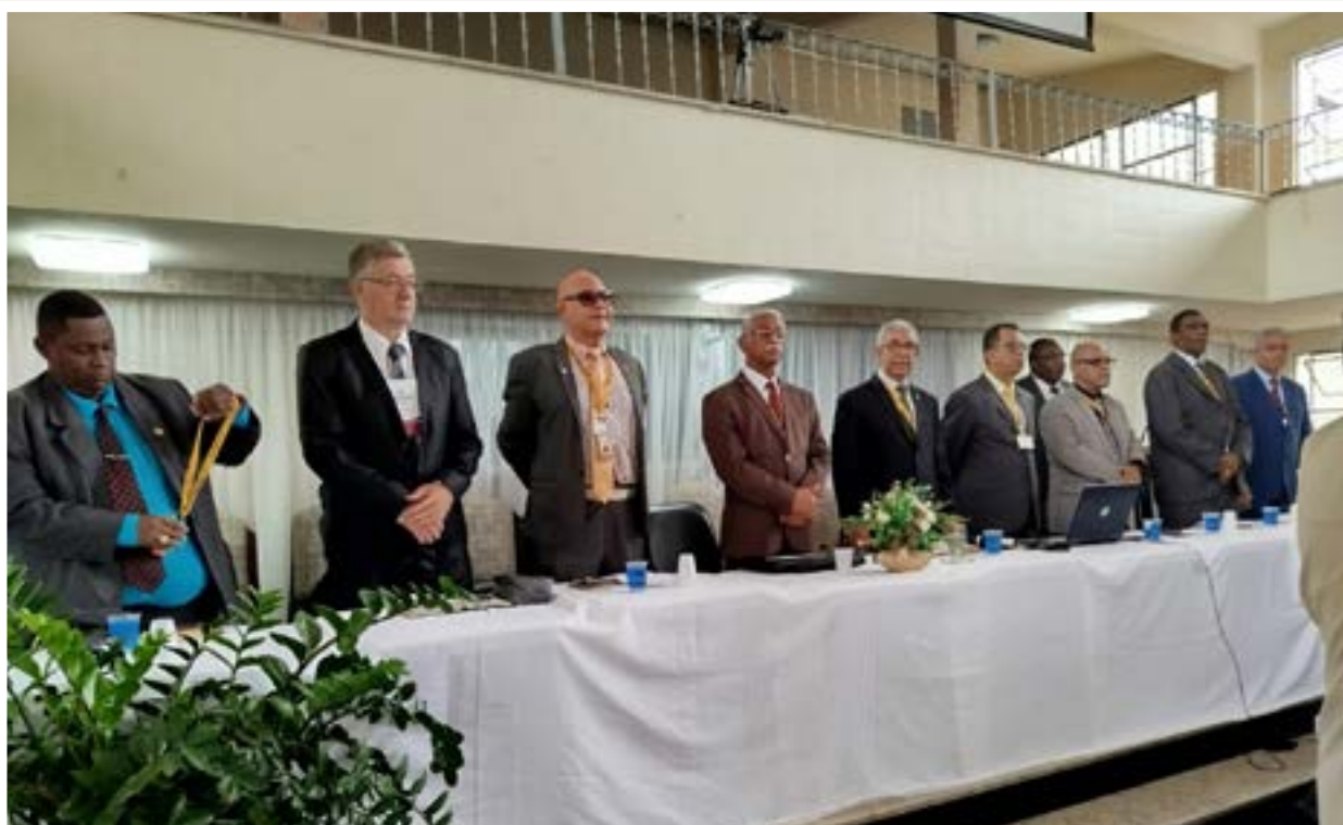
Mesa Diretora da COMADERJ.