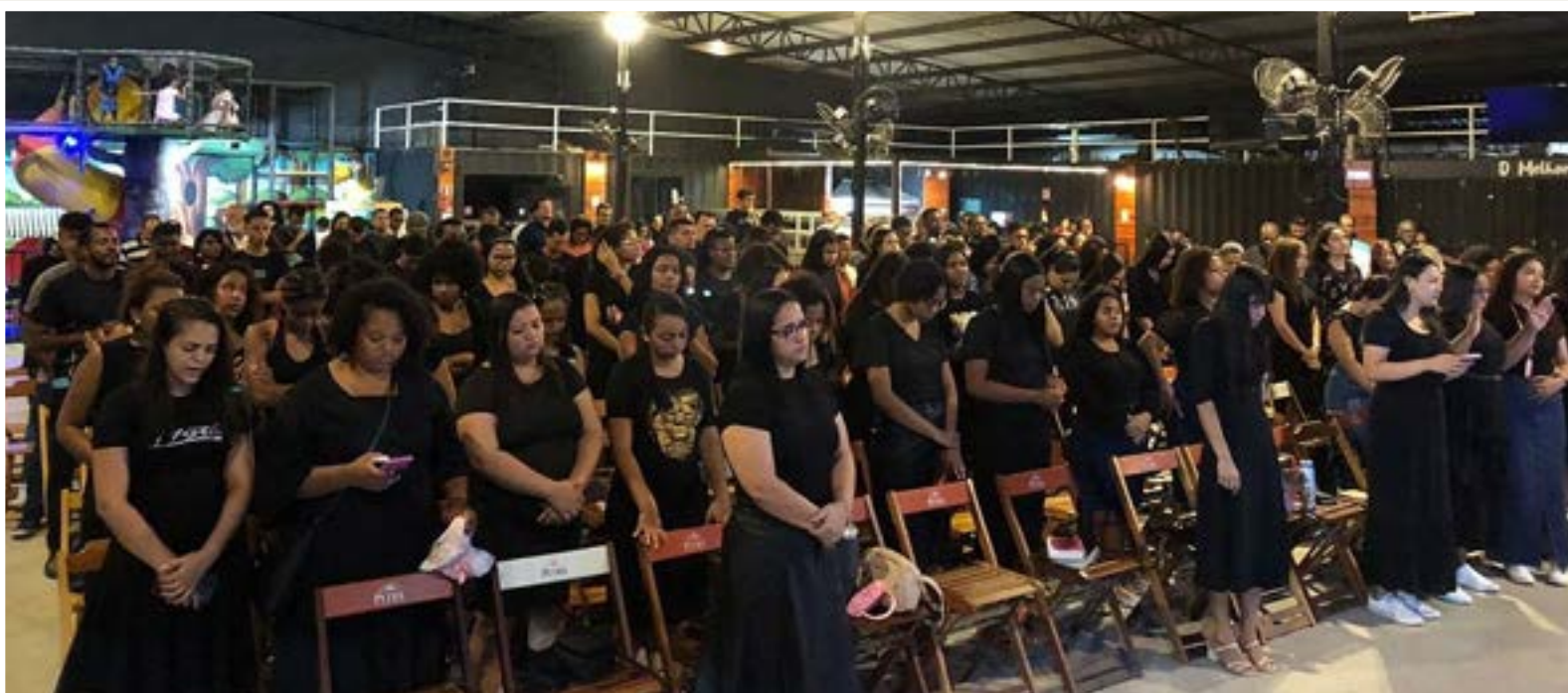
Jovens da UMADERJ Niterói e Maricá.