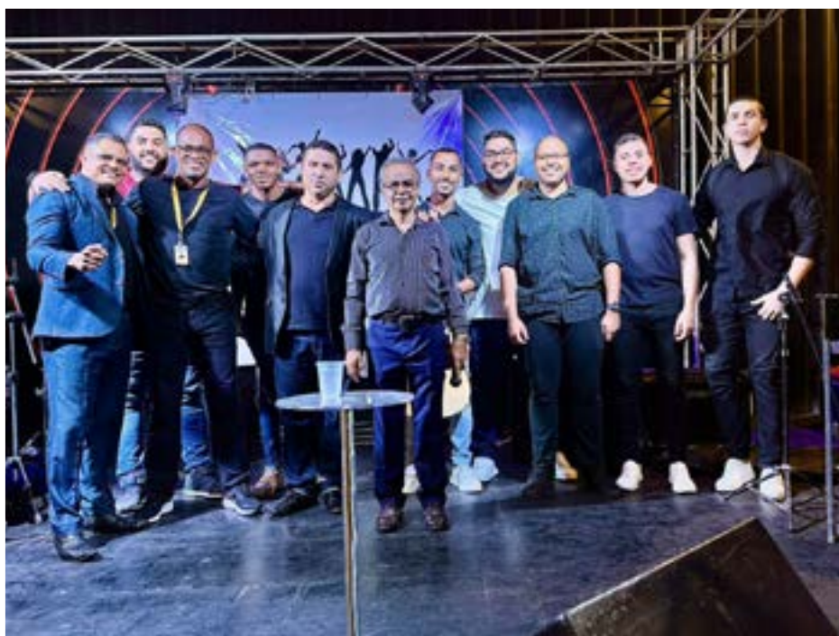
Equipe responsável pelo Pré Congresso da UMADERJ Niterói e Maricá.