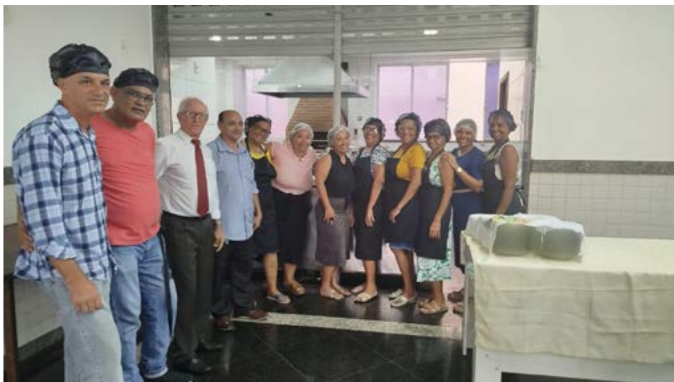
Equipe da cozinha.