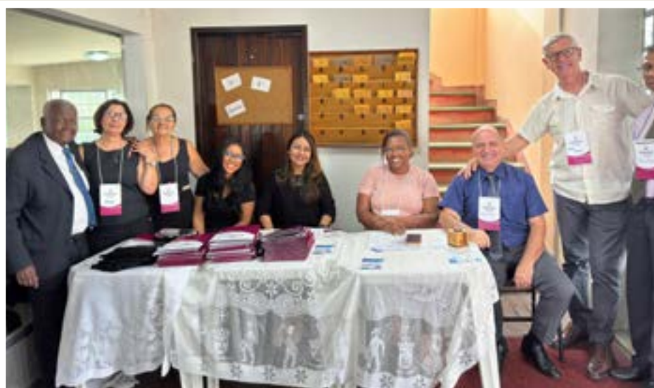
Equipe da recepção da Assembleia de Deus do Rocha.