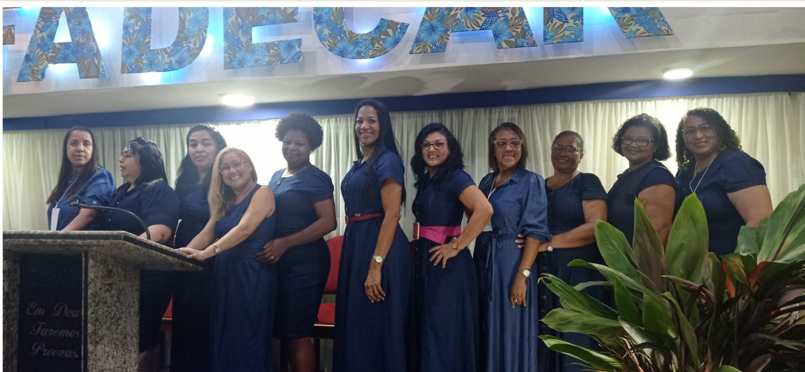
Diretoria da UFADECAR

grande guerreira, e a vida dela flui, ela aprende a conquistar espaços que até então não sabiam que poderiam conquistar, lugares que não poderiam estar, e nós damos a oportunidade dela ser feliz, descobrir que além de ser mãe, esposa, ela é mulher, ser humano e uma pessoa que além de ser cuidada por Deus, pode cuidar de outras, e é isso que quero deixar pras mulheres, que estão aí sem saber para onde vão, sem saber o que fazer na igreja, que elas saibam que elas têm a oportunidade de prosseguir, além de conhecer ao Senhor, se conhecer, saber do valor que elas têm. Que Deus nos abençoe!